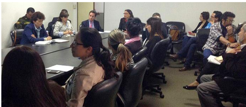
Consejo Distrital de Estupefacientes de Bogotá D.C