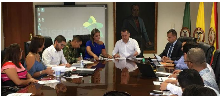
Consejo Seccional de Estupefacientes de Risaralda