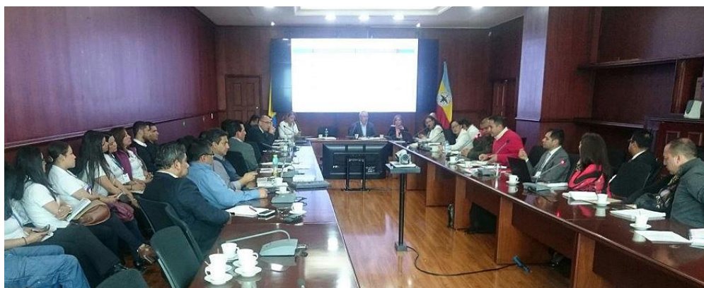
Consejo Seccional de Estupefacientes de Cundinamarca