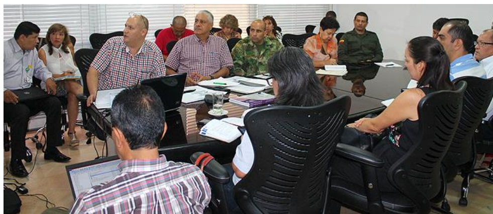
Consejo Seccional de Estupefacientes de Huila