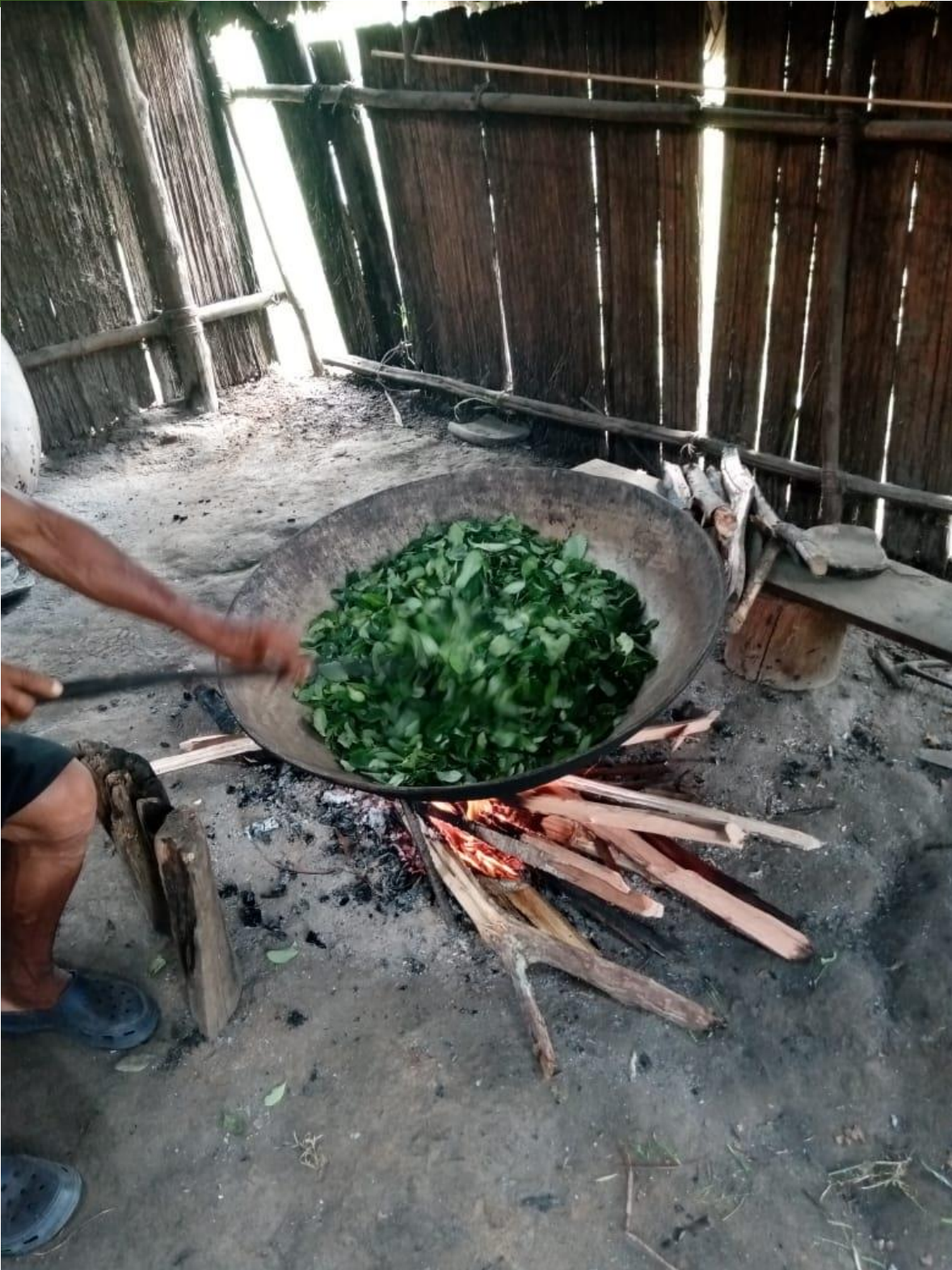
Preparación de la medicina ancestral korebaju, mambe.

ASOCIACIÓN DE AUTORIDADES TRADICIONALES INDÍGENAS DEL MUNICIPIO DE SOLANO CAQUETÁ Resolución No 147 del 12 de noviembre de 2014 NIT: 900794427-2