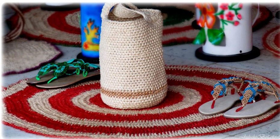
Mochila y sandalias (Elaboradas en pita de fique)

CARITO DEL PUEBLO ZENÚ, JURISDICCIÓN DEL MUNICIPIO DE LORICA, DEPARTAMENTO DE CÓRDOBA”, Del CABILDO EL CARITO DEL PUEBLO ZENÚ, JURISDICCIÓN DEL MUNICIPIO DE SANTA CRUZ DE LORICA, DEPARTAMENTO DE CÓRDOBA” La Comunidad de El Carito es un grupo humano con características identitarias propias de las culturas campesinas del caribe colombiano, este proyecto se llevó a cabo con el fin de ayudar a esta comunidad a conocer y fortalecer sus derechos como población Indígena y a establecer sus propias leyes.