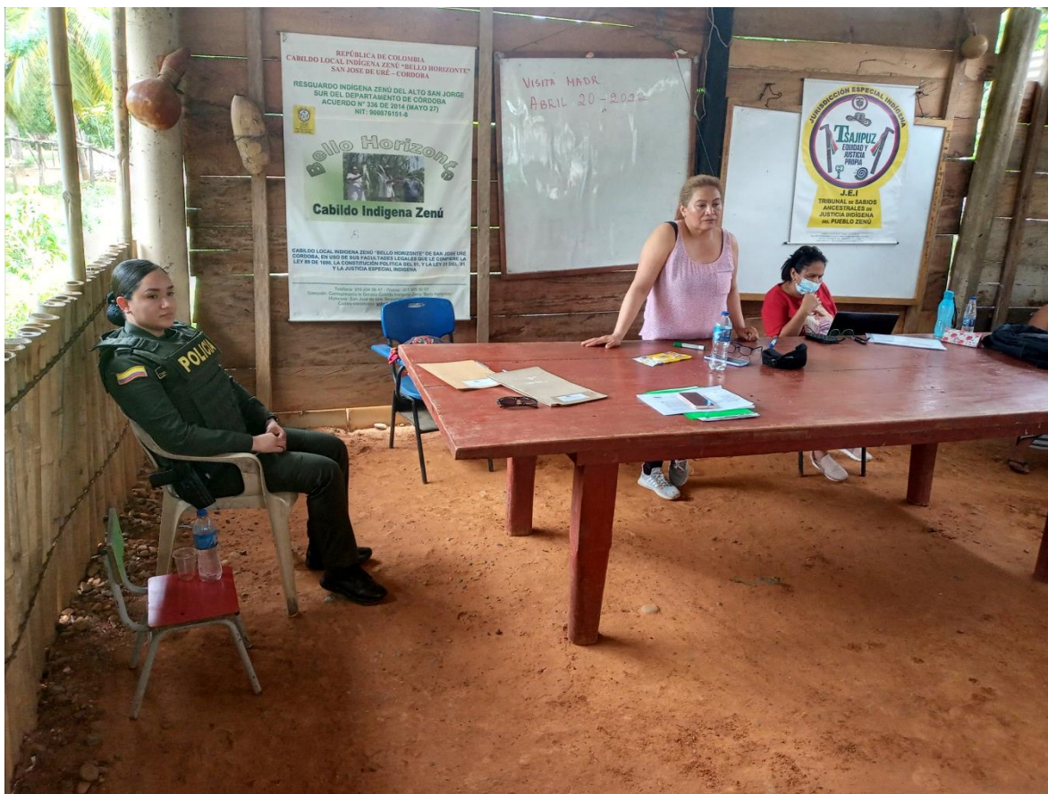
Ilustración 7. Taller de mujeres indígenas, con participación de la Policía Nacional

En los procesos de capacitación sobre jurisdicción especial y organización indígena, se suele invitar a autoridades del sistema jurisdiccional ordinario, con el ánimo de ir limando asperezas en lo que concierne a la coordinación de las dos jurisdicciones.