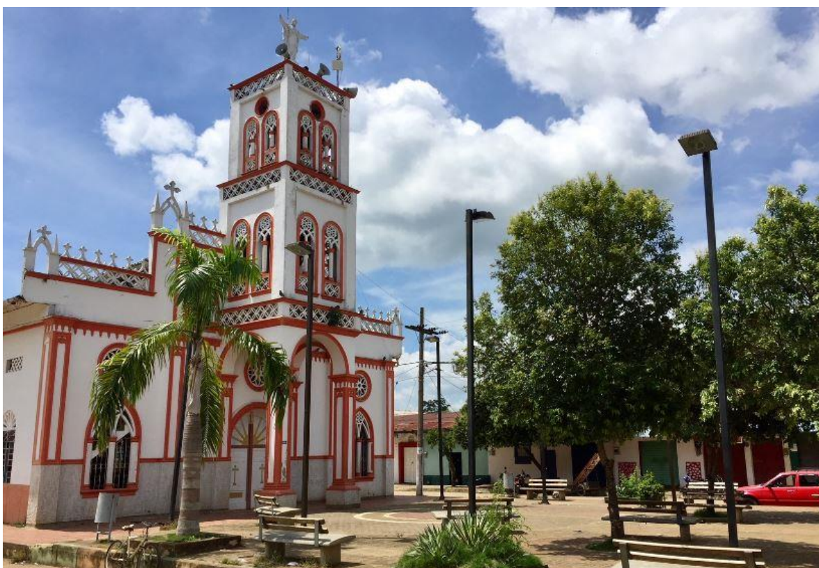
Imagen 2. Catedral y parque central de San José de uré

Parque central y la Catedral de San José de Uré, un símbolo histórico del municipio por la confluencia cultural de indígenas y negritudes alrededor del sincretismo religioso que alberga el Santo de la población.