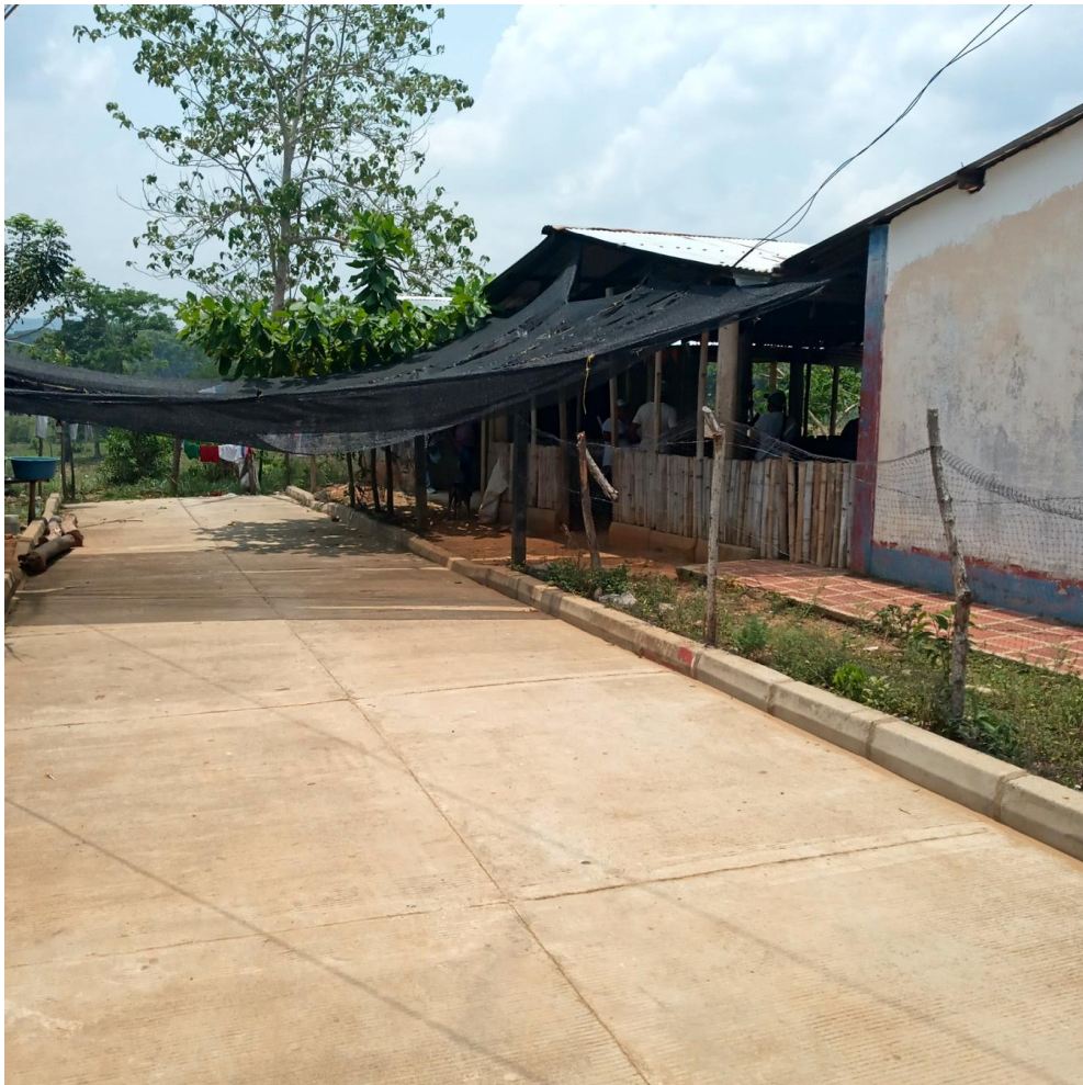
Calle de la comunidad Dorada en San José de Uré, donde se encuentra ubicada la casa de gobierno del cabildo Bello Horizonte.

“En los años 30s, la violencia en Colombia generada por el enfrentamiento entre liberales y conservadores, causó desplazamientos de indígenas y campesinos que buscaron refugio en zonas de montaña. En esta zona se estableció una colonia de gente que huía de esa guerra, procedente de distintos puntos del departamento de Córdoba y Sucre. Algunos