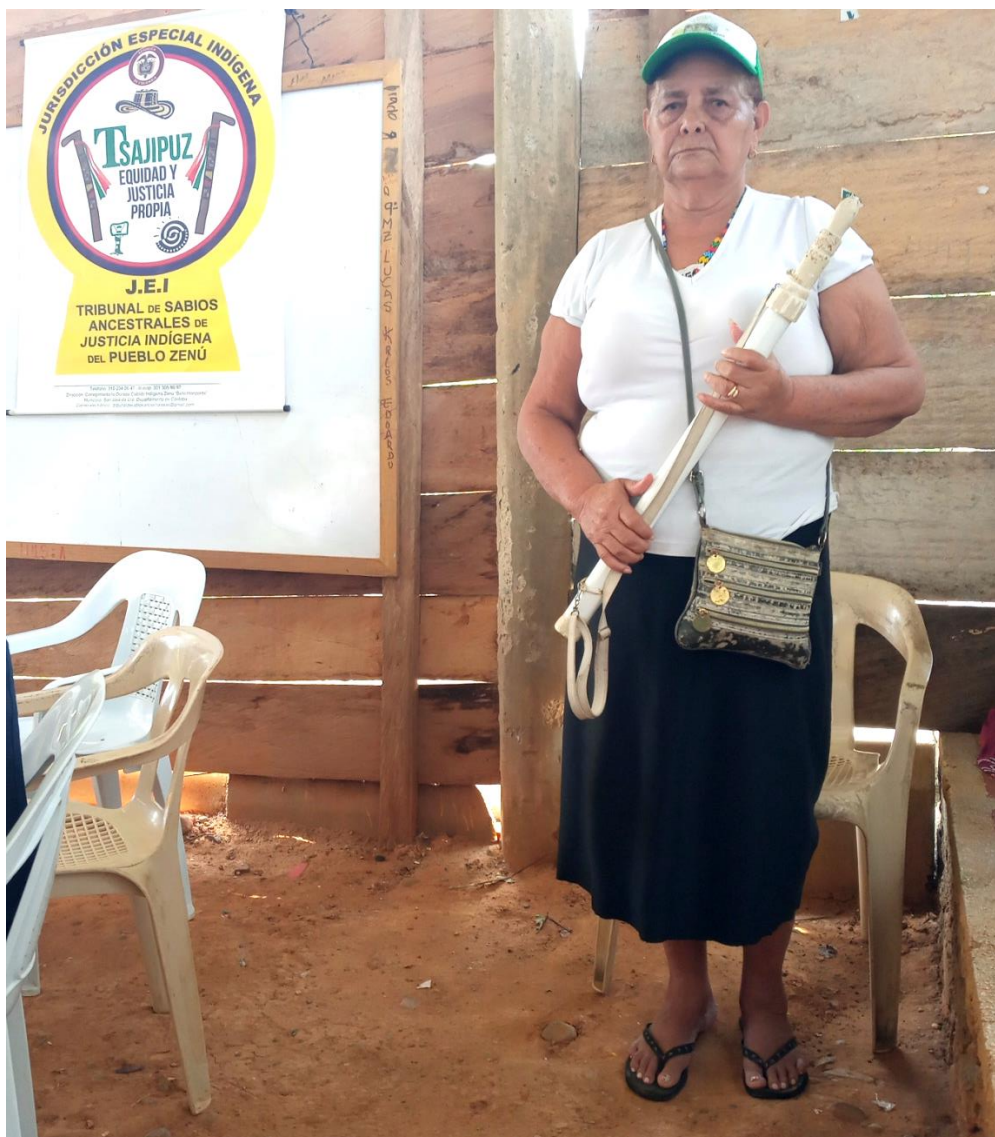
La mujer viene participando cada vez más en los órganos de dirección y de gobierno de los cabildos indígenas zenú de San José de Uré

El cabildo La Libertad, es la máxima autoridad de la comunidad indígena que habita en el pueblo Puerto Colombia, ubicado en el municipio de San José de Uré.