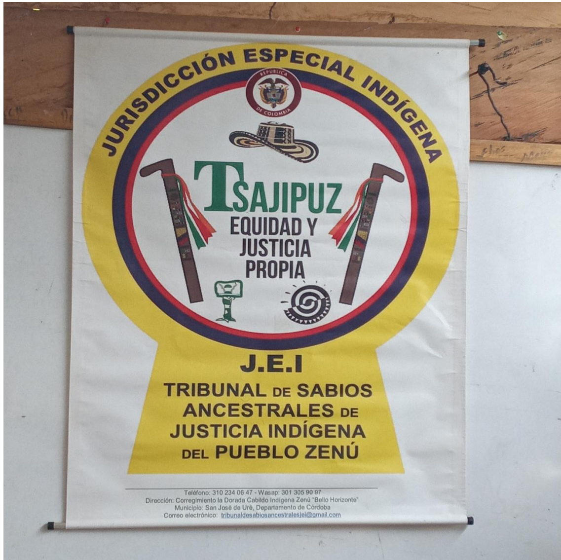
Ilustración 6. Símbolo del tribunal de sabios ancestrales de justicia indígena.

Los cabildo indígenas de San José de Uré, vienen implementando al interior de su sistema jurisdiccional propios, los tribunales de sabios ancestrales de justicia indígena, como órgano máximo en la administración de su sistema de normas consuetudinarias.