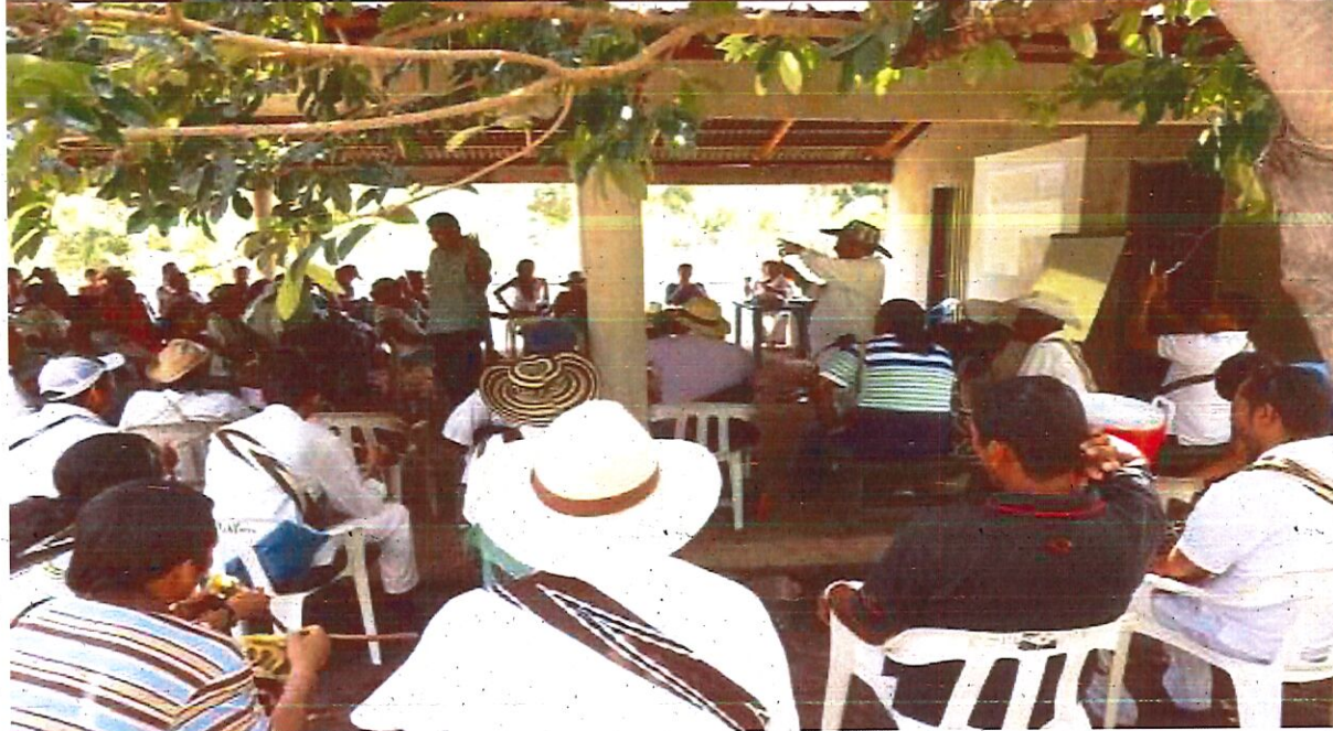
JORNADA DE CAPACITACION EN MATERIA DE DERECHOS HUMANOS, JURISDICCION ESPECIAL INDIGENA, DELITOS SEXUALES EN MENORES Y MUJERES Y DELITOS CONTRA LA FAMILIA.