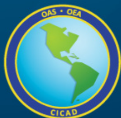
Comisión Interamericana para el Control del Abuso de Drogas

Organización de los Estados Americanos Secretaría de Seguridad Multidimensional Comisión Interamericana para el Control del Abuso de Drogas