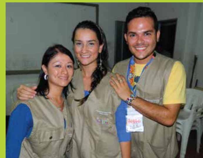
Facilitadores del Programa Familias Fuertes

El programa Familias Fuertes NO es adecuado para las familias que presenten alguna de las siguientes condiciones en su núcleo familiar: