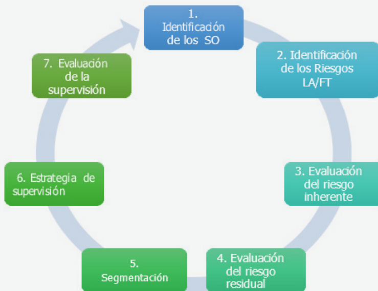
Figura 1. Proceso de Supervisión Basada en Riesgo.