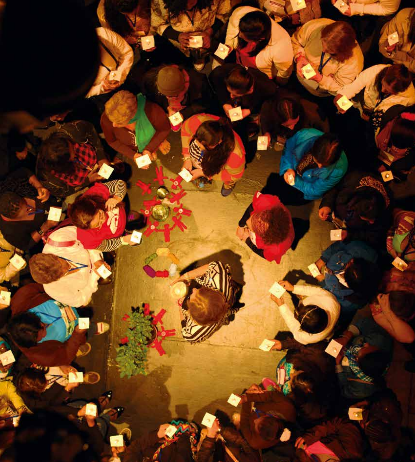
II Encuentro Nacional de Mujeres Bogotá - 2016