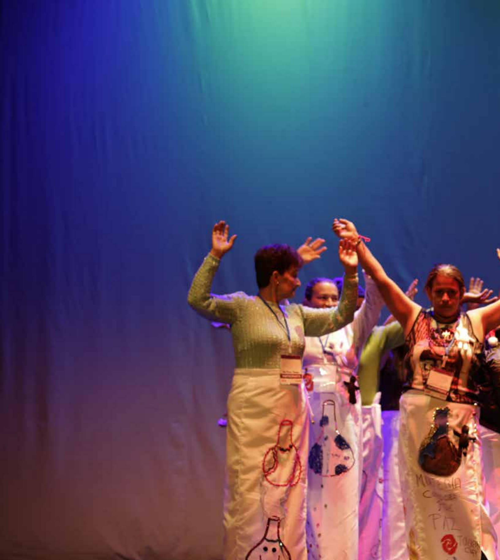
Tercer momento Estrategia de Reparación Integral a mujeres Víctimas - Cali - 2016