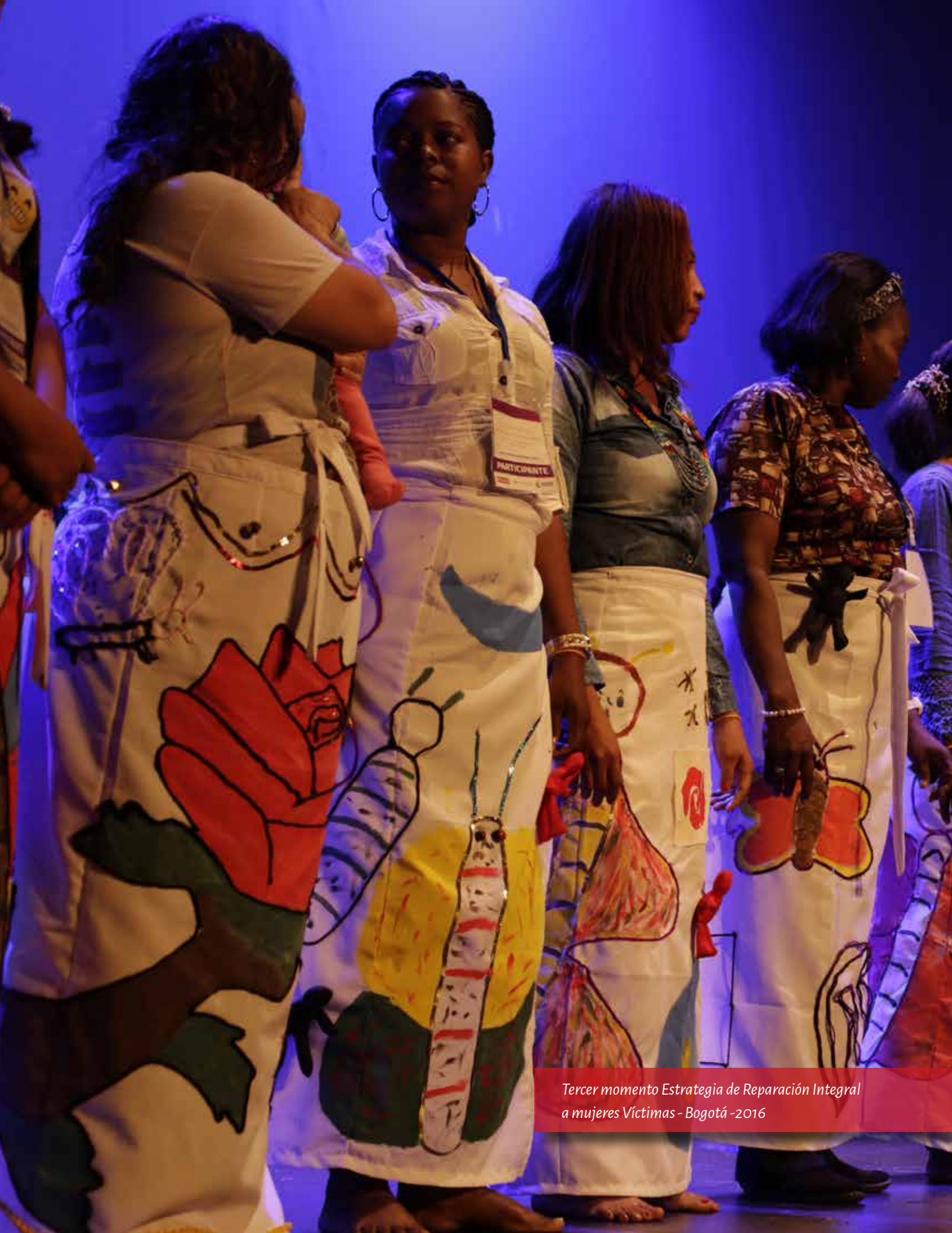
Tercer momento Estrategia de Reparación Integral a mujeres Víctimas - Bogotá -2016