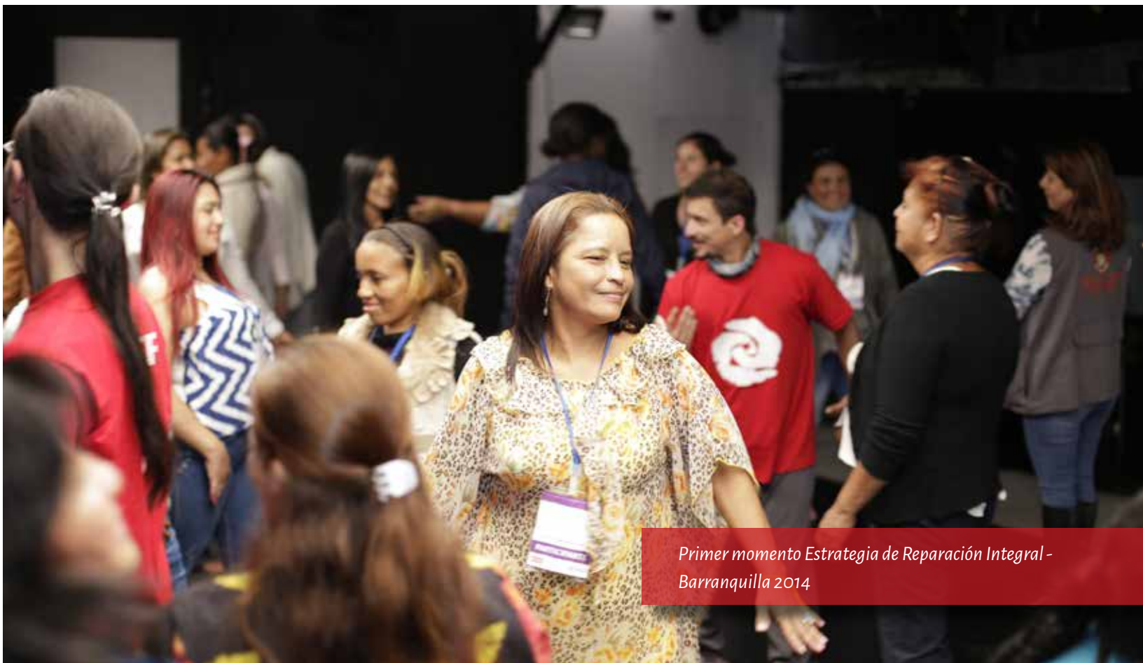
Primer momento Estrategia de Reparación Integral - Barranquilla 2014