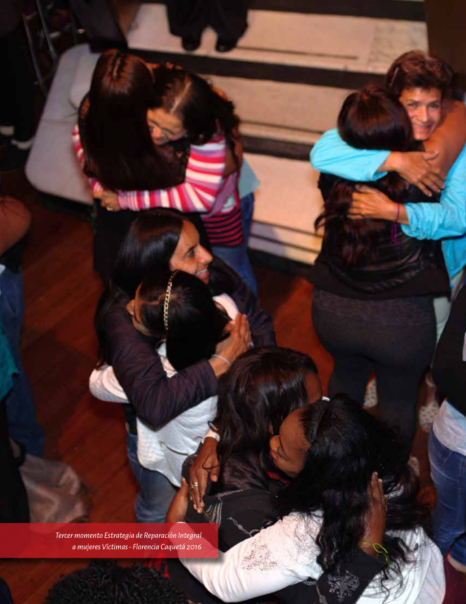
Tercer momento Estrategia de Reparación Integral a mujeres Víctimas - Florencia Caquetá 2016