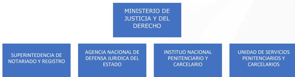
Ilustración 8. Entidades del sector Justicia y del Derecho encuestadas