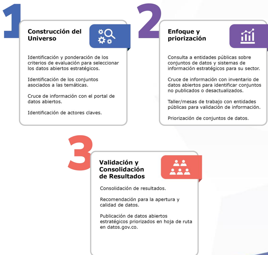
Ilustración 1. Metodología de identificación de datos abiertos estratégicos de la hoja de ruta

Esta metodología contó con las siguientes fases: