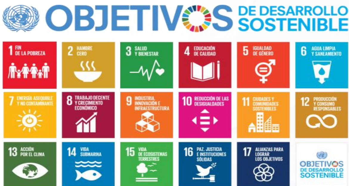
Ilustración 6. Objetivos de Desarrollo Sostenible