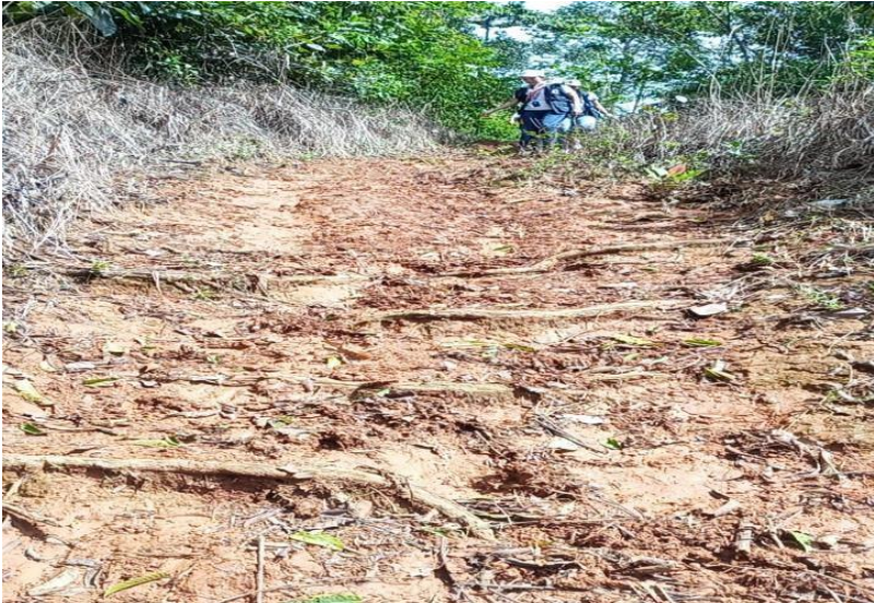
El estado de las vías para llegar al Resguardo Indígena Dochama.