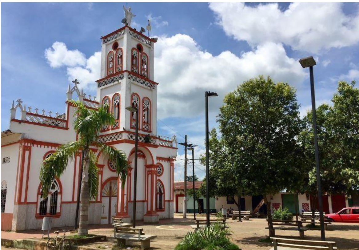
Imagen 2. Catedral y parque central de San José de Uré

Parque central y la Catedral de San José de Uré, un símbolo histórico del municipio por la confluencia cultural de indígenas y negritudes alrededor del sincretismo religioso que alberga el Santo de la población.