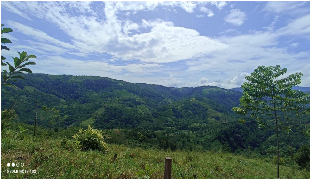
Territorio del Resguardo Indígena Dochama.

suficientes frente a la situación de vulneración de derechos que actualmente enfrenta la población rural del departamento. En el 2010, la Defensoría del Pueblo señaló en la Resolución Defensoría 058 que la disputa por el control del territorio es el principal motivo de despojo de tierras en el departamento y es originada por intereses como la apropiación de la riqueza del suelo, sus recursos naturales, los beneficios económicos y otras ventajas estratégicas que otorga a grupos armados ilegales, particularmente, a los grupos pos desmovilización de las AUC y a otros intereses nacionales y transnacionales. Esta situación supera el actual marco jurídico transicional y requiere la acción de otras entidades públicas para la solución de dichos problemas. Quienes sufrieron estos acontecimientos fueron la comida de BATATADO, siendo totalmente desplaza quien hoy asienta en el municipio de San José de Uré.