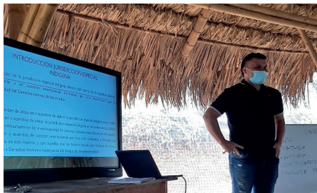
Ilustración 4. Desarrollo del proyecto de justicia propia del resguardo Kwet Kina - Las Mercedes del pueblo Nasa