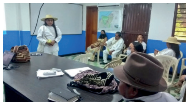
Ilustración 7. Taller de análisis y alcances del Decreto 1953 en el proceso de fortalecimiento de los mecanismos de control social en la instancia de justicia del pueblo Wiwa, con acompañamiento del pueblo Kankuamo