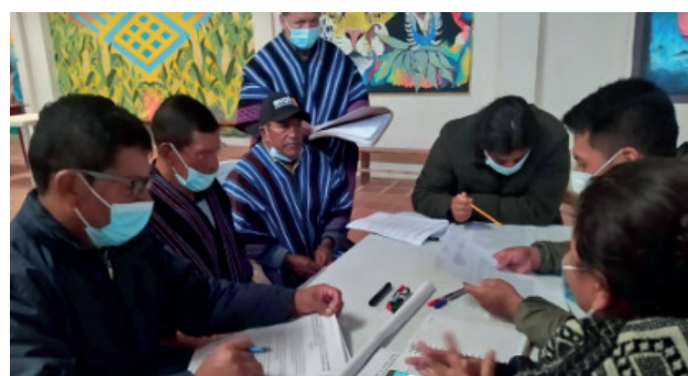
Ilustración 6. Taller sobre resolución de conflictos realizado por el Cabildo Inga de Colón