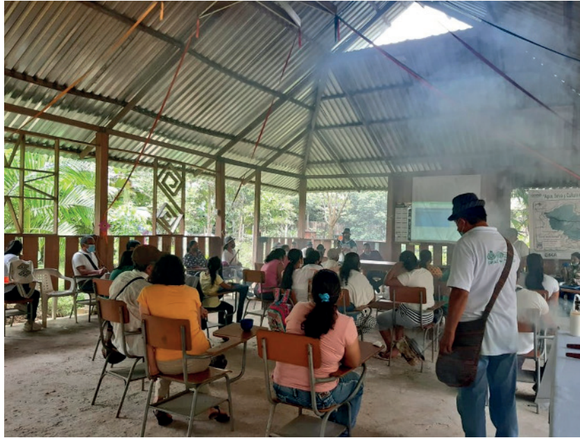
Ilustración 2. Cabildo Los Pastos, San José del Pepino

de noviembre y hasta el 30 de abril de 2021, se presta asistencia técnica y financiera mediante el apoyo de 31 proyectos de pueblos indígenas, que han sido presentados por sus cabildos, resguardos u organizaciones representativas. Las propuestas corresponden a doce departamentos: