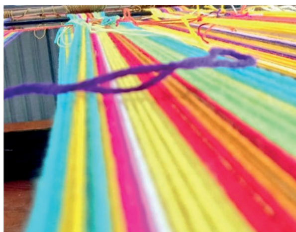
Ilustración 1. Tejiendo la guanga para el fortalecimiento de la justicia propia

Con la creación del Banco de Iniciativas y Proyectos para el Fortalecimiento de la Justicia Propia de los Pueblos Indígenas de Colombia, BIP, el Ministerio de Justicia y del Derecho dispone de un instrumento para conocer las iniciativas y registrar los proyectos en materia de justicia generados por los pueblos indígenas y contruidos a partir del conocimiento propio de sus fortalezas y oportunidades de mejora en relación con la administración de justicia propia y la coordinación con el Sistema Nacional de Justicia, en el marco del Plan Nacional de Desarrollo 2018-2022. Con este instrumento se realizan convocatorias anuales a nivel nacional, a las cuales puede postularse cualquier comunidad indígena con el diligenciamiento de formatos y términos de referencia dispuestos por la entidad.