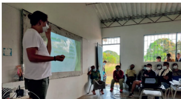
Ilustración 5. Actividades del proyecto de mandato comunitario para la protección de los niños, niñas, adolescentes y mayores del Resguardo Caño Jabón. Vigencia 2021