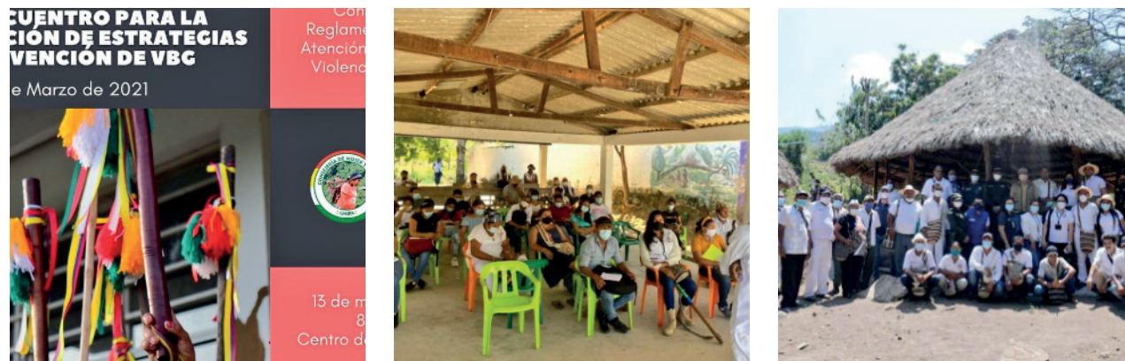
Ilustración 9. Capacitación en jurisdicción especial indígena y encuentro interjurisdiccional del pueblo Kankuamo

En el marco de la formación que culminó el 11 de diciembre de 2020 se inscribieron 657 personas y se certificaron 175 de ellas, de las cuales 105 son mujeres y 70 hombres. En consecuencia, los operadores que se lograron certificar corresponden a los siguientes departamentos: Antioquia 10, Arauca 1, Atlántico 7, Bogotá, D.C. 28, Bolívar 15, Boyacá 11, Caldas 2, Caquetá 3, Casanare 2, Cauca 8, Cesar 2, Chocó 3, Córdoba 6, Cundinamarca 4, Huila 1, La Guajira 10, Magdalena 2, Meta 1, Nariño 10, Norte de Santander 10, Putumayo 1, Risaralda 6, Santander 10, Sucre 8, Tolima 7 y Valle del Cauca 7.