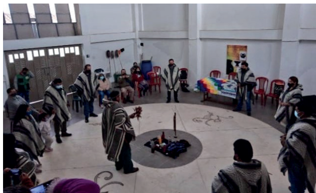
Ilustración 3. Actividades para la construcción y fortalecimiento del sistema de derecho propio de la Asociación de Cabildos y Autoridades Tradicionales Indígenas ASOIN - La Frontera