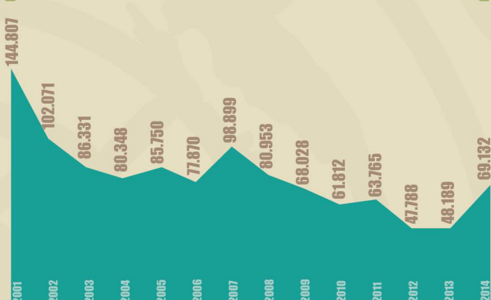
Hectáreas sembradas de coca 2001-2014

Territorio afectado por primera vez en los últimos tres años